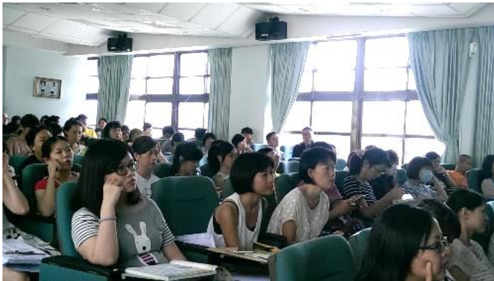
認真聽講專注的神情