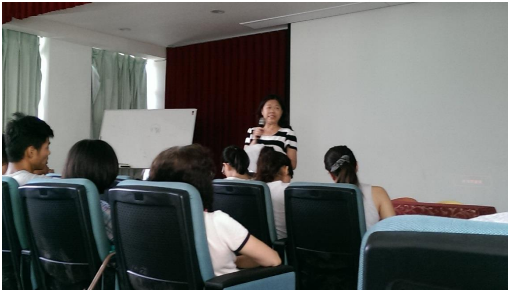
校長主持全校校務會議