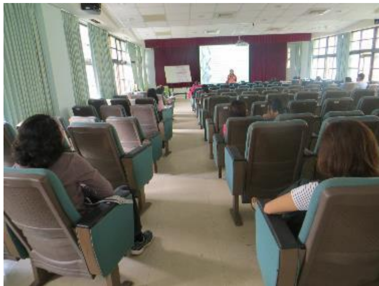
家長們也仔細聆聽