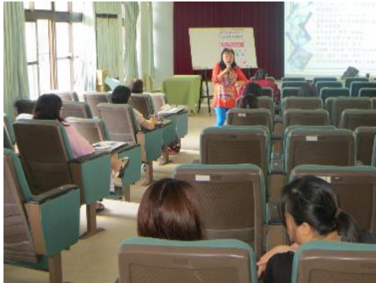
講師和家長們有所互動