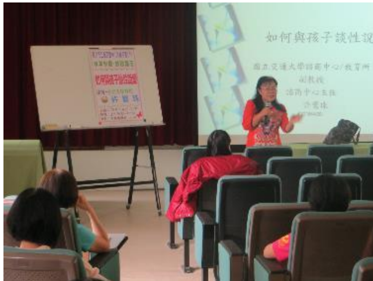
講師演講內容豐富精彩